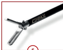
5 C-GRASP 18mm Maullänge